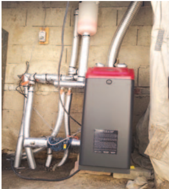
우리 엄마, 아빠 집을 부탁해! 주거환경지원사업3