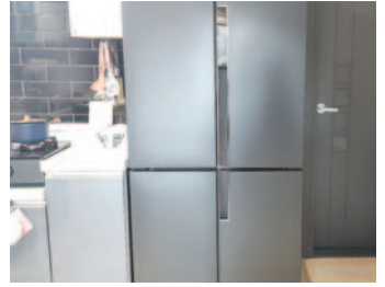
우리 엄마, 아빠 집을 부탁해! 주거환경지원사업2