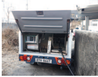
우리 엄마, 아빠 집을 부탁해! 주거환경지원사업1