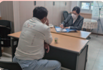
2021.03.03 2021년 법률상담