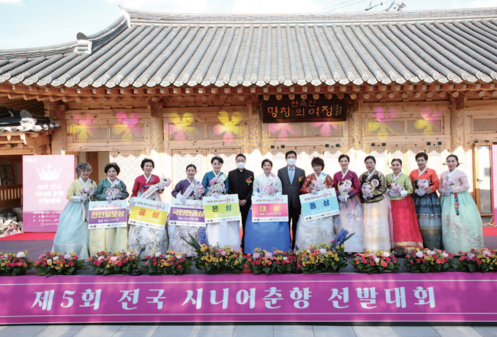
2021년 제5회 전국시니어촌향선발대회 시상식