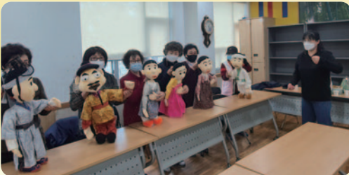
2021.04.05 인형극봉사단 새 작품 '흥부전' 연습