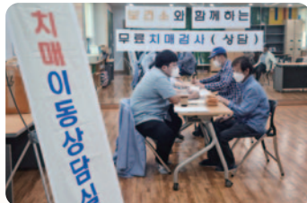
2021.06.07 무료 치매검사