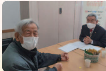
2021.03.09 2021년 노인심리상담