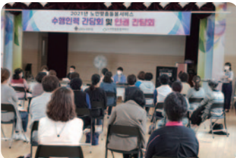
2021.05.26 노인맞춤돌봄서비스수행인력 간담회 및 인권 간담회