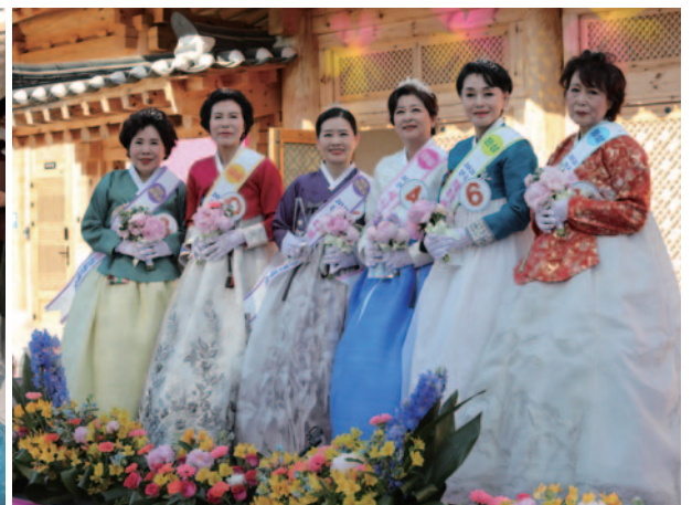
KBS전주방송 “아침마당” 출연