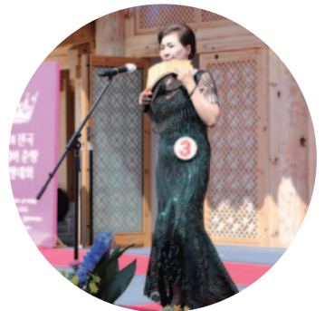
시니어춘향 후보들의 장기자랑