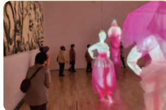
2021.05.21 시니어추향 전주 아침마당 출연