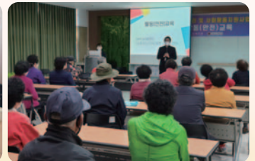
2021.03.22 노인일자리 활동안전교육