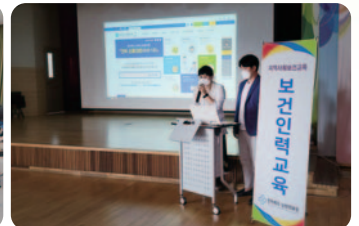
2021.06.25 남원의료원연계교육 '노인질환 및 관리방법'